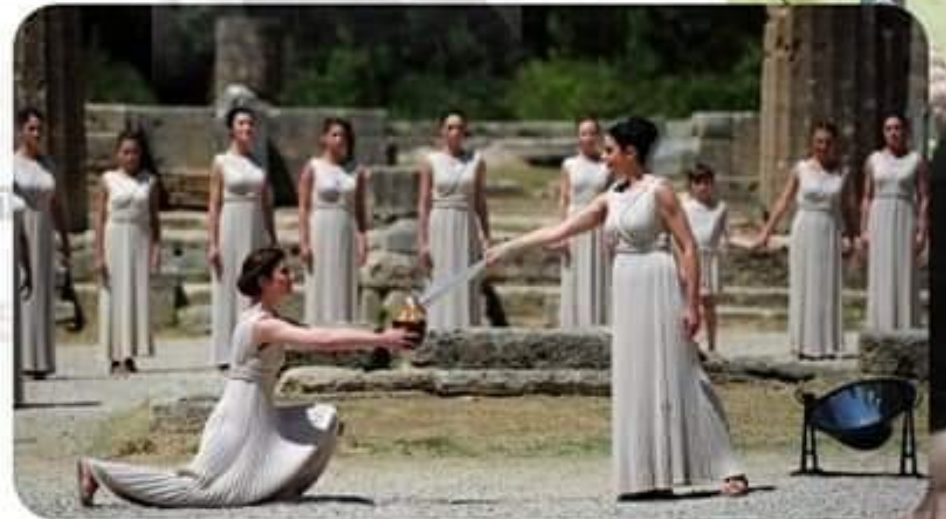
මධ්‍යම සමරවීර - විද්‍යාවේ පිංතූරු ස්‍රී ලංකා විද්‍යා සහ පාලන විද්‍යා මධ්‍යම (USL)