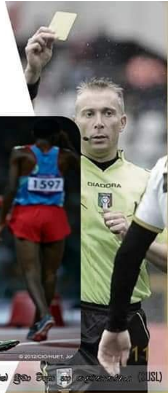
සෞඛ්‍ය හා ආර්ථික අධ්‍යයනය - 10 ශ්‍රේණිය