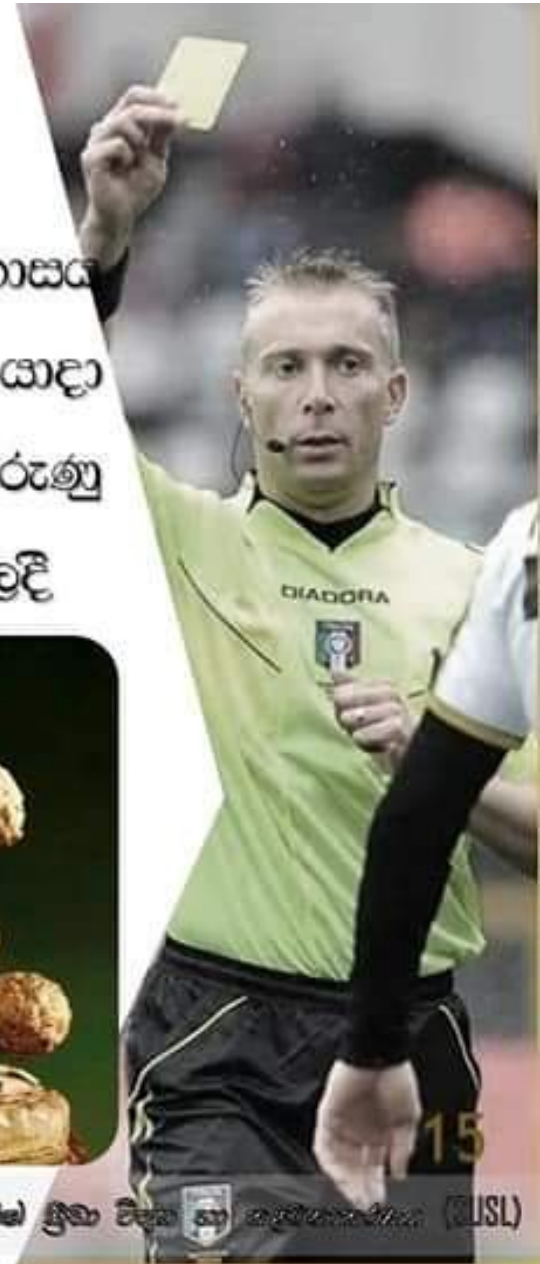
සෞඛ්‍යය හා ශාරීරික අධ්‍යාපනය - 10 ශ්‍රේණිය