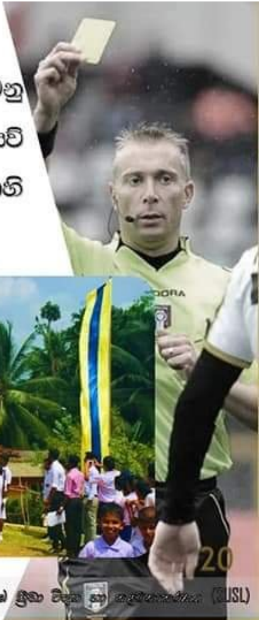
සෞඛ්‍ය හා ශාරීරික අධ්‍යාපනය - 10 ශ්‍රේණිය