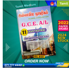
2024 A/L Islamic Civilization Past Paper Book (Tamil Medium) ₹ 850.00 or 3 X ₹ 283.33 with KOKO