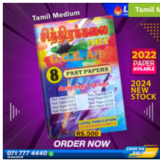
2024 A/L Art Past Paper Book (Tamil Medium) ₹ 500.00 or 3 X ₹ 166.67 with KOKO