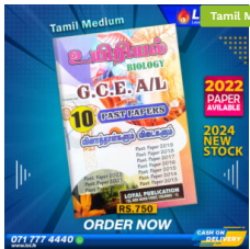
2024 A/L Biology Past Paper Book (Tamil Medium) ₹ 750.00 or 3 X ₹ 250.00 with KOKO