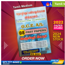
2024 A/L SFT Past Paper Book (Tamil Medium) ₹ 800.00 or 3 X ₹ 266.67 with KOKO