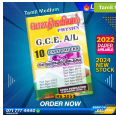
2024 A/L Physics Past Paper Book (Tamil Medium) ₹ 1,050.00 or 3 X ₹ 350.00 with KOKO