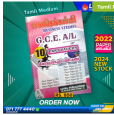
2024 A/L Business Studies Past Paper Book (Tamil Medium) ₹ 850.00 or 3 X ₹ 283.33 with KOKO