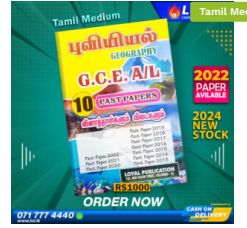
2024 A/L Geography Past Paper Book (Tamil Medium) ₹ 1,000.00 or 3 X ₹ 333.33 with KOKO