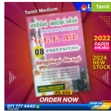
2024 A/L ET Past Paper Book (Tamil Medium) ₹ 850.00 or 3 X ₹ 283.33 with KOKO