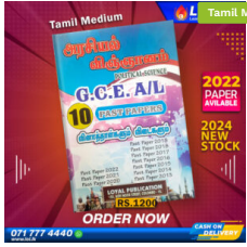
2024 A/L Political Science Past Paper Book (Tamil Medium) ₹ 1,200.00 or 3 X ₹ 400.00 with KOKO