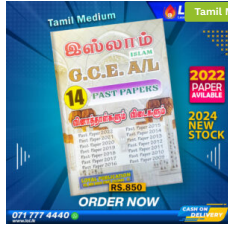
2024 A/L Islamic Past Paper Book (Tamil Medium) ₹ 850.00 or 3 X ₹ 283.33 with KOKO