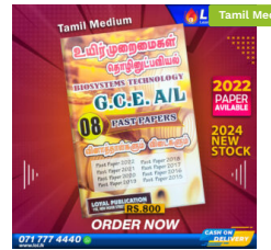
2024 A/L BST Past Paper Book (Tamil Medium) ₹ 800.00 or 3 X ₹ 266.67 with KOKO