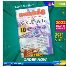
2024 A/L Accounting Past Paper Book (Tamil Medium) ₹ 1,000.00 or 3 X ₹ 333.33 with KOKO