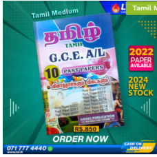
2024 A/L Tamil Past Paper Book (Tamil Medium) ₹ 850.00 or 3 X ₹ 283.33 with KOKO