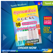
2024 A/L Chemistry Past Paper Book (Tamil Medium) ₹ 1,000.00 or 3 X ₹ 333.33 with KOKO