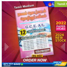
2024 A/L ICT Past Paper Book (Tamil Medium) ₹ 900.00 or 3 X ₹ 300.00 with KOKO