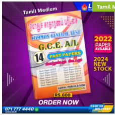
2024 A/L Common General Test Past Paper Book (Tamil Medium) ₹ 600.00 or 3 X ₹ 200.00 with KOKO