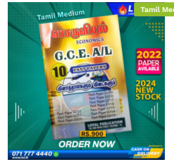
2024 A/L Economics Past Paper Book (Tamil Medium) ₹ 900.00 or 3 X ₹ 300.00 with KOKO