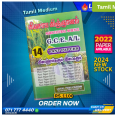
2024 A/L Agricultural Science Past Paper Book (Tamil Medium) ₹ 1,000.00 or 3 X ₹ 366.67 with KOKO