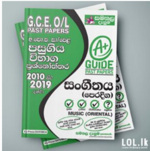
GCE O/L EXAM, MUSIC O/L Music Past Paper Book