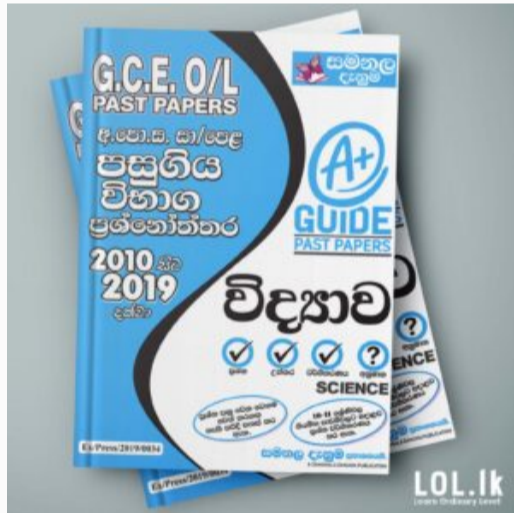
GCE O/L EXAM, SCIENCE O/L Science Past Paper Book