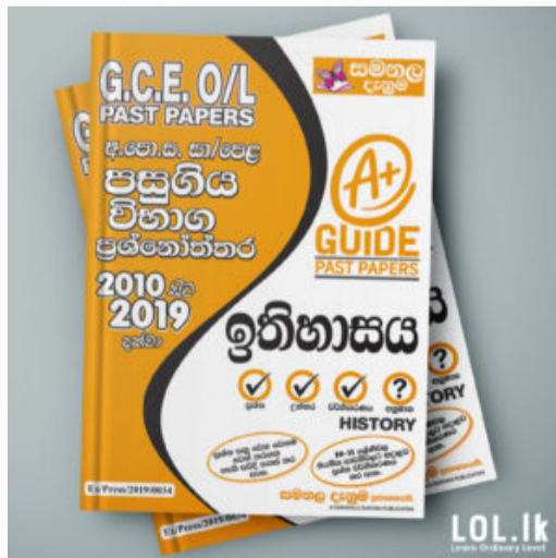
GCE O/L EXAM, HISTORY O/L History Past Paper Book