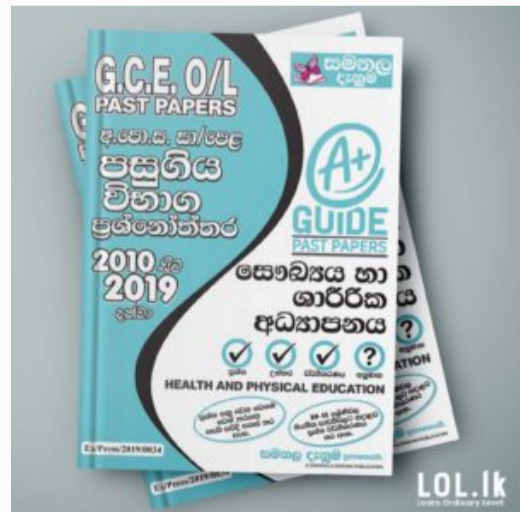
GCE O/L EXAM, HEALTH & PHYSICAL EDUCATION O/L Health & Physical Education Past P...