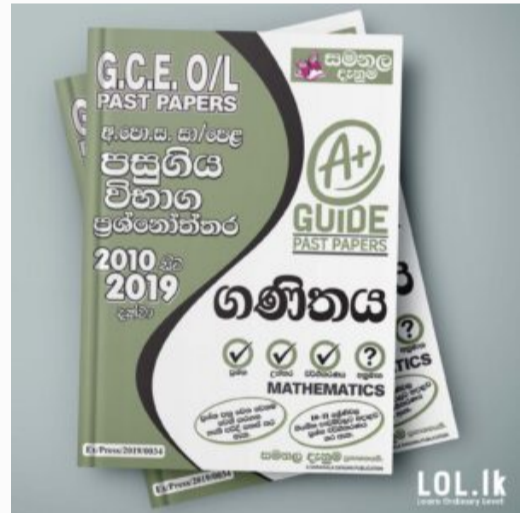
GCE O/L EXAM, MATHEMATICS O/L Mathematics Past Paper Book