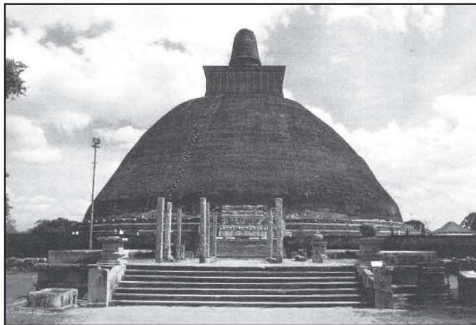
(ජේතවන, මහසෙන්, පටී ධාතුව, වාහල්කඩ, අඩි 232 ක්, ටුපාරාමය)